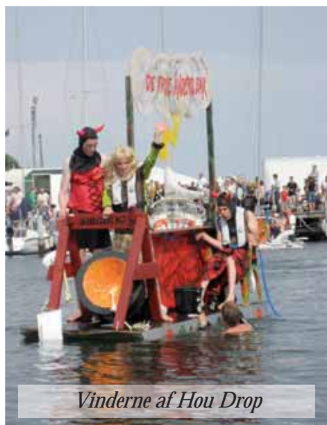
Vinderne af Hou Drop