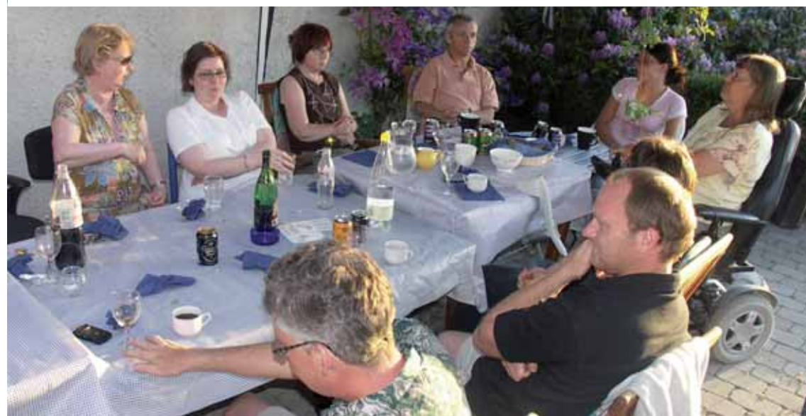
Glimt fra sommerfesten

Leder: »Lige adgang til kulturen« Sommersjov på Egmont Højskolen