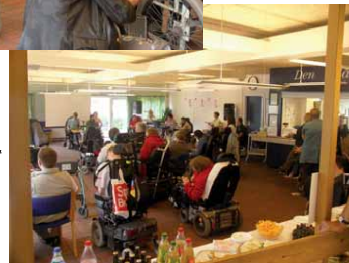
Dagen blev markeret med en reception.