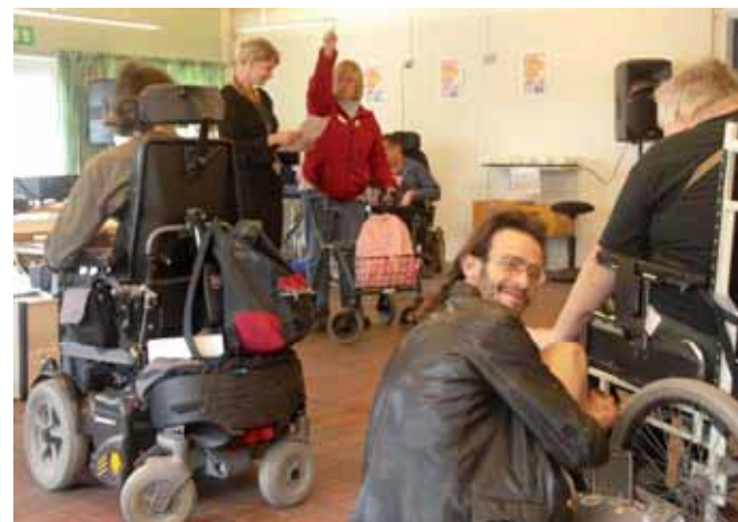
En af vore vigtigste samarbejdspartnere - Handi-K@ - fyldte 10 år den 15. juni 2007.